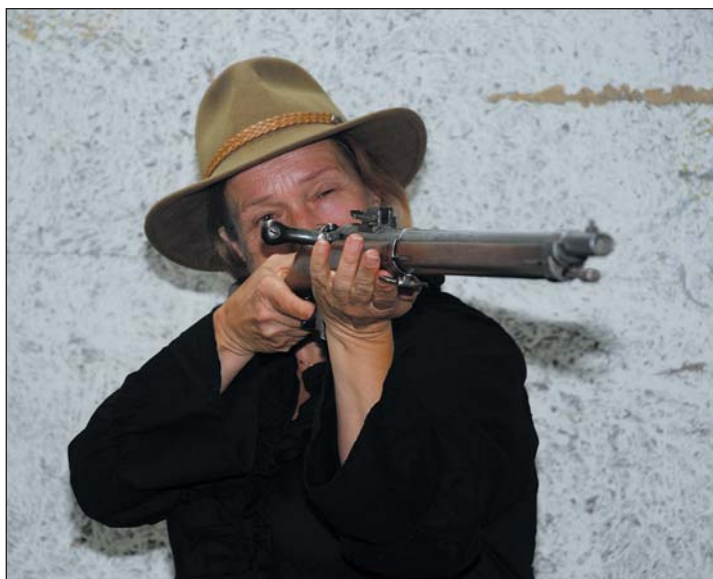
Deelnemers mogen schietjas, schiethandschoen, schietriem en schietbril gebruiken, maar het hóeft niet! Kijk, da’s leuk!