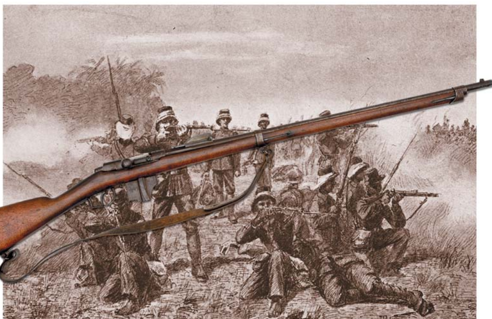
Het Beaumont-Vitali geweer M71/88. Eronder ligt een prent van Nederlandse koloniale troepen tijdens een operatie nabij Lamsajoeng, Atjeh. Onze inschatting is dat de gepentekende geweren enkelschots Beaumonts zijn.

Nu begrijpen wij het volkomen als er lezers zijn die al wilden doorbladeren na het lezen van de term Beaumont geweer. Hè bah, gaat AK56 WapMag nu ook al die slaapverwekkende tour op? Mensen, als wij het een kans gaven en helemaal naar Oudkarspel reden om het NK Beaumont mee te maken, geef u dit verslag dan ook een kans. Senk joe verrie muts.